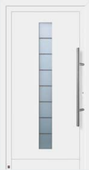
Motivo 904 in tonalità bianco traffico RAL 9016.