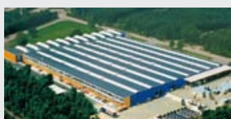
Hörmann Genk NV, Belgio