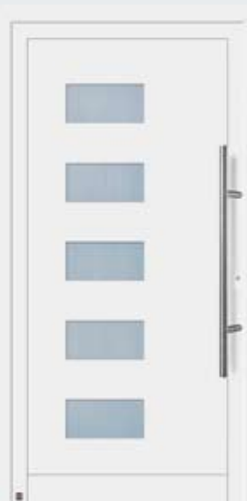
Motivo 902 in tonalità bianco traffico RAL 9016.