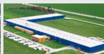
Hörmann Legnica Sp. z o.o., Polonia