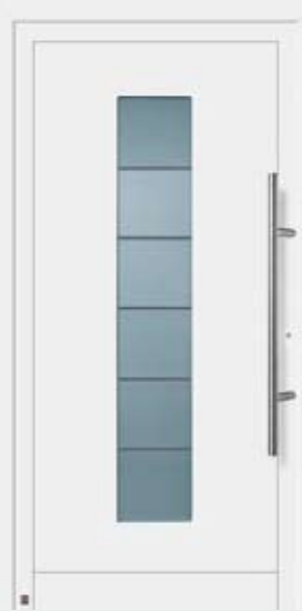
Motivo 906 in tonalità bianco traffico RAL 9016.