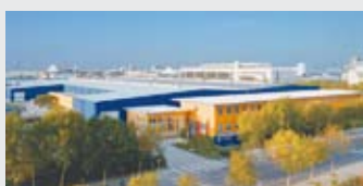
Hörmann Beijing, Cina