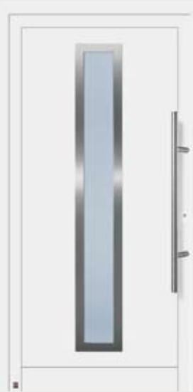
Motivo 975 in tonalità bianco traffico RAL 9016.