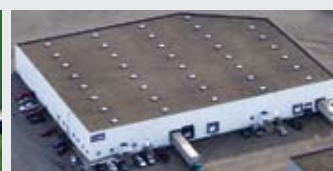
Hörmann Flexon, Leetsdale PA, USA

Hörmann è l'unico produttore nel mercato internazionale che raccoglie le più importanti componenti per l'edilizia sotto un unico marchio.