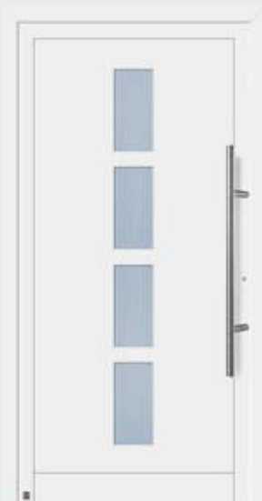
Motivo 900 in tonalità bianco traffico RAL 9016.