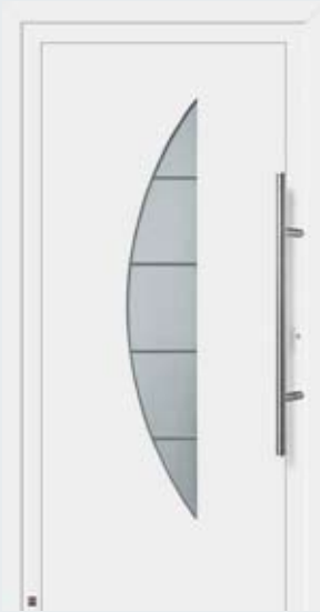
Motivo 908 in tonalità bianco traffico RAL 9016.