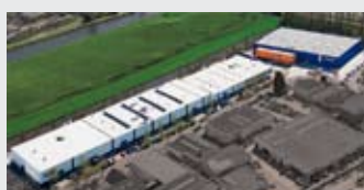
Hörmann Alkmaar B.V., Paesi Bassi