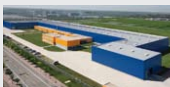
Hörmann Tianjin, Cina